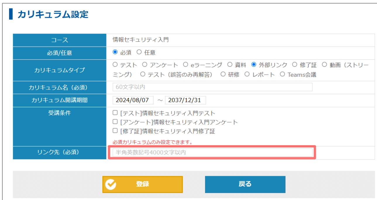
カリキュラム設定（外部リンク）

外部リンクカリキュラムに設定する「リンク先」の文字数上限が、 300文字から4000文字に拡張されます。